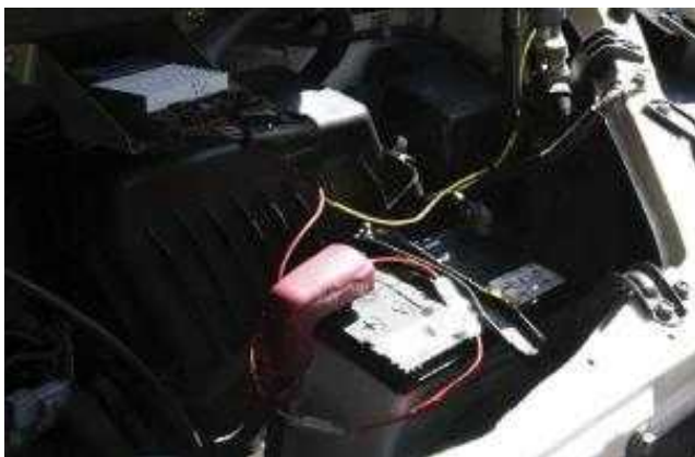
取付後プラス(赤線)とアース(黄、黒線)