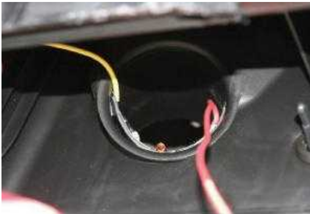
エアフィルターへの空気出口方向に 取付