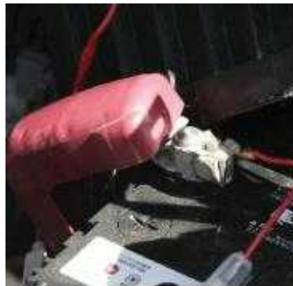
バッテリーのプラス側にヒューズ側取付